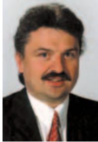
Klaus Peter Söllner Sprecher des Spezialitätenwettbewerbs und Landrat des Landkreises Kulmbach

»Entwerfen Sie mit uns die kulinarische Landkarte der Metropolregion Nürnberg! Nirgendwo gibt es so viele handwerklich geprägte Metzgereien, Bäckereien und Brauereien wie hier. Ob Zoigl- oder Zwickl-Bier, Aischgründer Karpfen, Küchla oder Produkte aus der Genussregion Oberfranken – hier lebt es sich einfach lecker. Beteiligen Sie sich beim 1. Spezialitätenwettbewerb der Metropolregion Nürnberg, werden Sie UNSER ORIGINAL! «